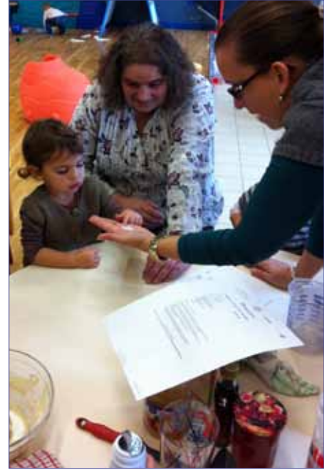
Les Mini Master Chefs à l'œuvre ! Ils ont Goûté pour VOUS... Crêpes à base de farine de châtaigne avec Confitures maison, Sirop d'érable, compotes