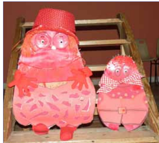
Une invitée de marque : Madame Rouge accompagnée de son p'tit bout ...

Au Ram, on y voit rouge... du Rouge en veux-tu en voilà et sous toutes les coutures :