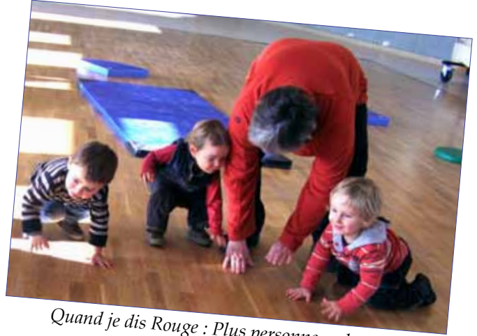
Quand je dis Rouge : Plus personne ne bouge !