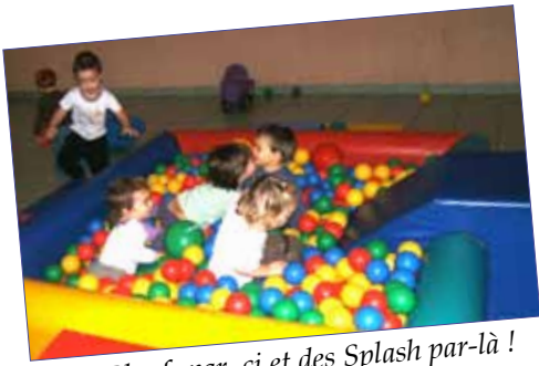
Des Ploufs par-ci et des Splash par-là !