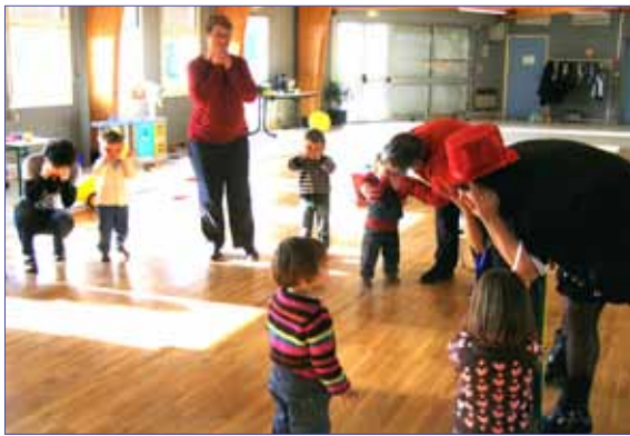
Et Madame Rouge fait comme ça et encore comme çaaaaaaaaaaaaa