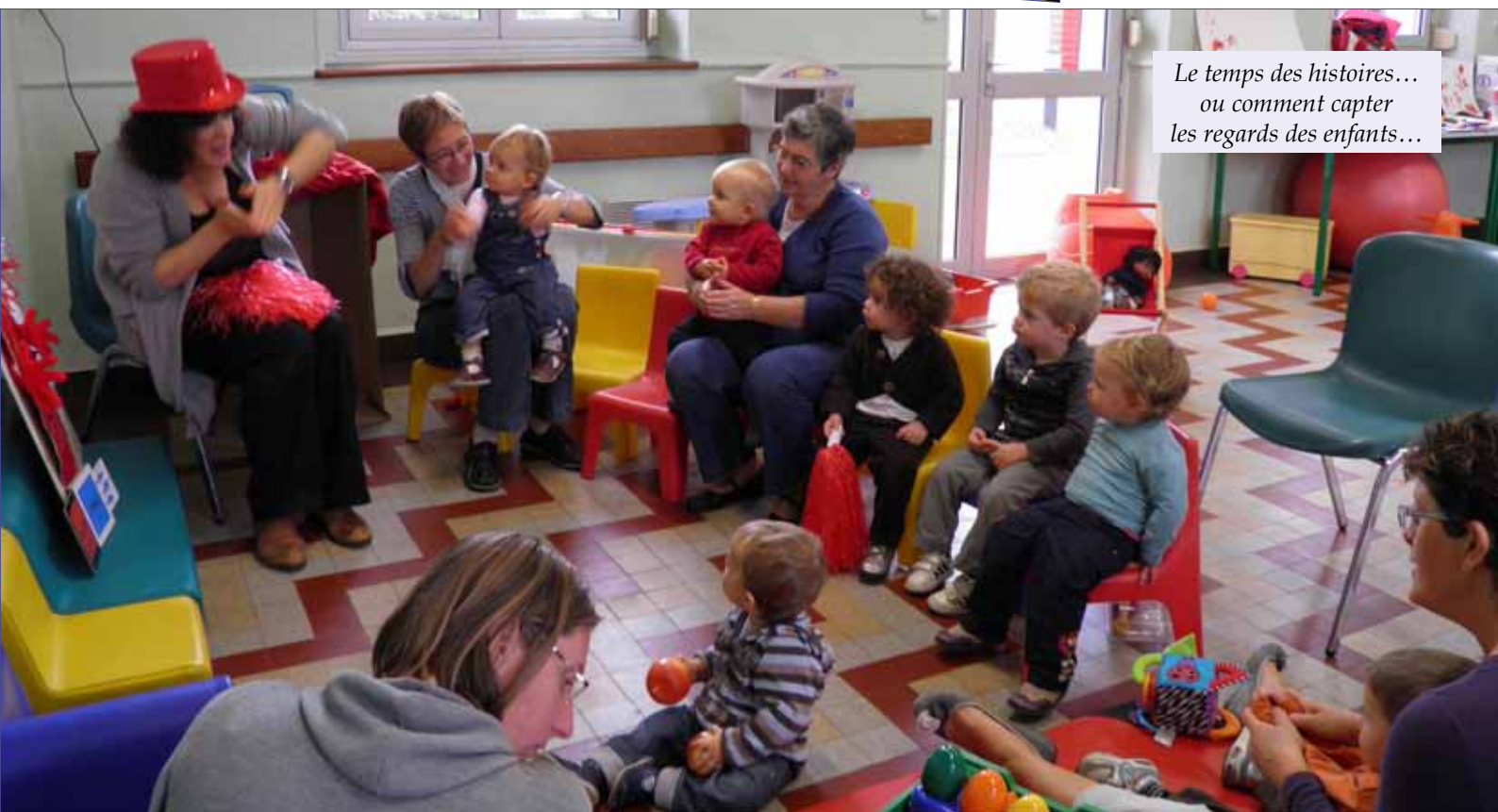
Le temps des histoires... ou comment capter les regards des enfants...