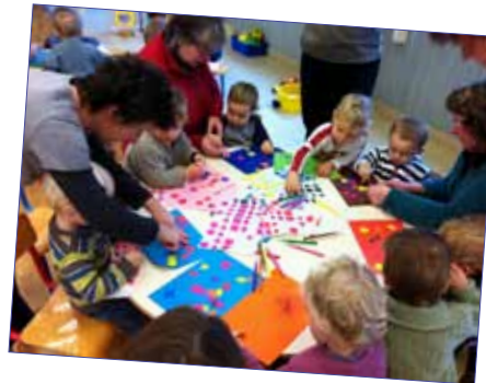
Tenir un crayon et dessiner cela demande beaucoup de concentration et de précision...