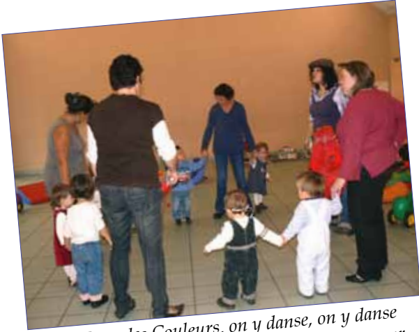
Au Pays des Couleurs, on y danse, on y danse Au Pays des Couleurs, on y danse tous en cœur

Une Ronde chantée à gestes avec des personnages Hauts en Couleur