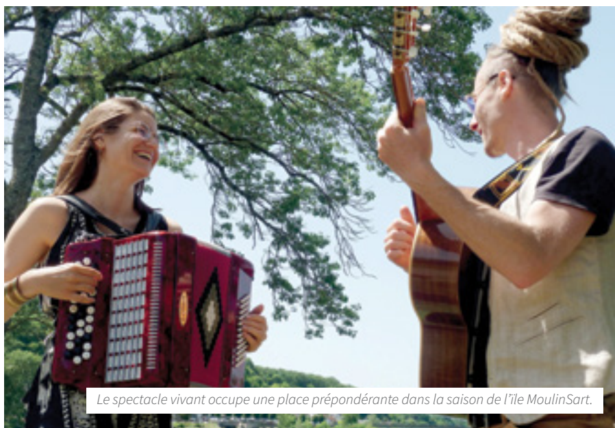
Le spectacle vivant occupe une place prépondérante dans la saison de l'île MoulinSart.

Concernant le Musée, le parcours de visite sera à nouveau accessible dès les 6 et 7 avril lors des Journées Européennes des Métiers d'Art, week-end d'animations, de démonstrations, de rencontres d'artistes et d'artisans autour du thème de la broderie. Le fil conducteur des actions du Musée en 2024 sera les animaux. « L'exposition principale, intitulée "Animaux d'ici et d'ailleurs", se veut accessible à tous, valorisant les ateliers de Malicorne et les artistes contemporains » décrit Céline Moron, responsable du Musée. Les animaux seront ainsi omniprésents dans les quatre expositions temporaires, les collections permanentes, les ateliers créatifs et les événements proposés. La visite, quant à elle, permettra la (re)découverte d'un patrimoine local sarthois au travers des faïences de Malicorne et d'un ancien site de production qu'est l'Usine Chardon.