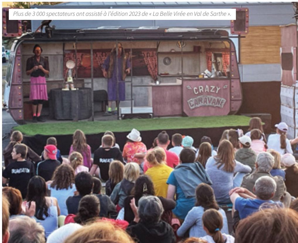
Plus de 3 000 spectateurs ont assisté à l'édition 2023 de « La Belle Virée en Val de Sarthe ».

Festival engageant, et aussi engagé. « La Belle Virée en Val de Sarthe » s'inscrit dans une démarche d'événementiel responsable en proposant des actions pour réduire son impact environnemen-