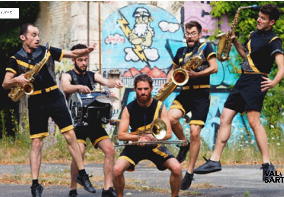
La Cie Mouv'N Brass dans ses œuvres !

www.facebook.com/labellevireenvaldesarthe