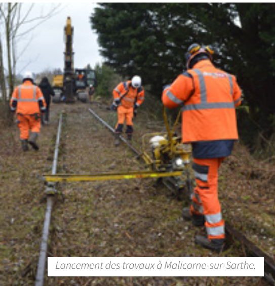
Lancement des travaux à Malicorne-sur-Sarthe.

Fruit d'une large collaboration, le programme de créations de voies vertes en Sarthe prévoit à terme 140 km d'itinéraires en site propre (hors Boulevard Nature autour de l'agglomération mancelle). D'une longueur de 29 km, le tronçon entre La Suze-sur-Sarthe et La Flèche sera opérationnel à la fin de l'année 2024. Les travaux ont débuté en janvier.