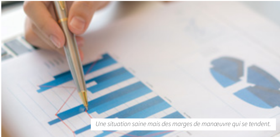
Une situation saine mais des marges de manœuvre qui se tendent.

Le Débat d'orientation budgétaire (DOB) du Val de Sarthe s'est déroulé le 15 février dernier. Le Conseil a pris acte de la bonne santé financière de la Communauté de communes dans un contexte qui se tend toutefois. Les élus envisagent une légère évolution de la fiscalité locale. Explications.