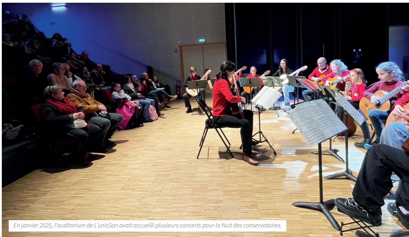
En janvier 2025, l'auditorium de L'unisSon avait accueilli plusieurs concerts pour la Nuit des conservatoires.

L'unisSon, école de musique et de danse du Val de Sarthe, s'est engagée dans une saison 2025-2026 conçue pour impliquer ses élèves et ouvrir ses portes au territoire, avec une programmation participative où l'engagement devient un instrument à part entière. Explications.