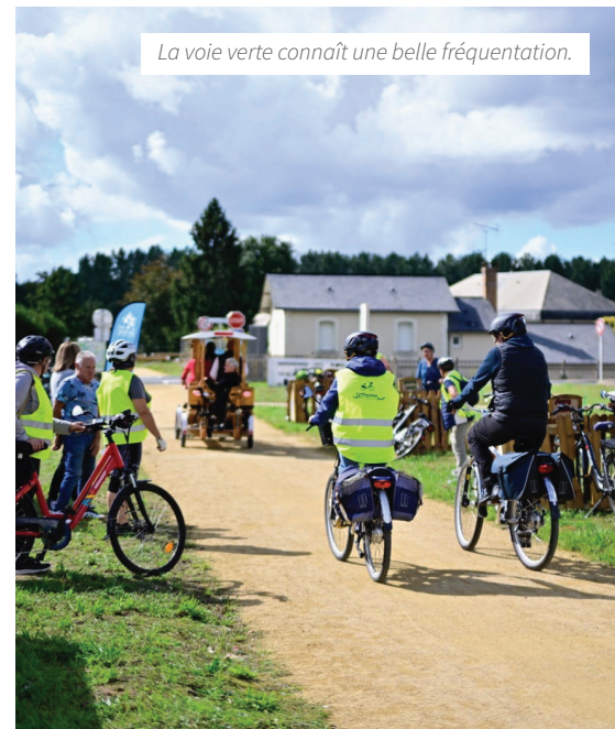
La voie verte connaît une belle fréquentation.

Au-delà des retombées économiques, la voie verte offre un nouvel espace de détente et de convivialité, idéal pour les familles, randonneurs, cyclistes, cavaliers et habitants dans leurs déplacements du quotidien. Avec la finalisation des deux derniers kilomètres vers l'ancienne gare de La Flèche, prévue d'ici 2027, cet axe doux confirme son rôle de colonne vertébrale touristique et intercommunale.