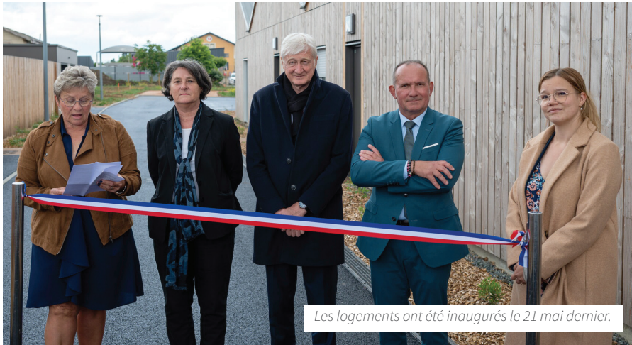
Les logements ont été inaugurés le 21 mai dernier.

Le 21 mai 2025, Sarthe Habitat, la Commune de Malicorne-sur-Sarthe et la Communauté de Communes du Val de Sarthe ont inauguré douze nouveaux logements sociaux dédiés aux seniors. Ce programme vient requalifier un quartier central et participe à la revitalisation du centre-bourg.