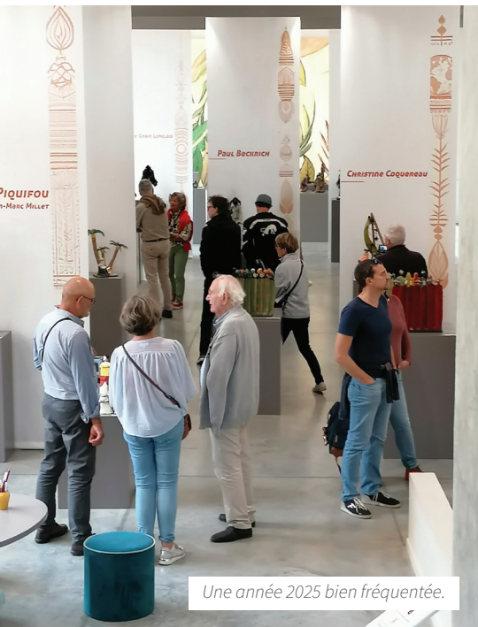
Une année 2025 bien fréquentée.