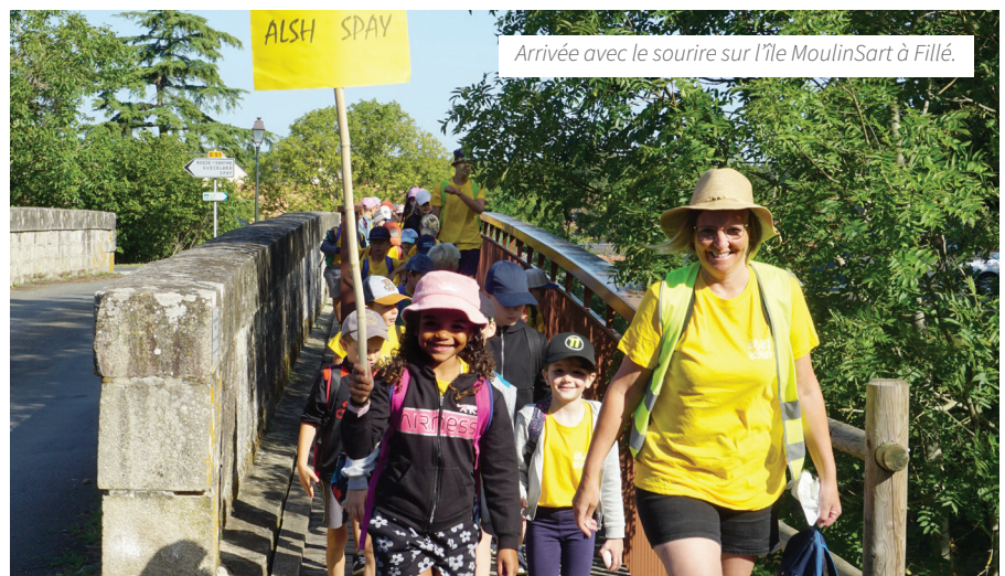
Arrivée avec le sourire sur l'île MoulinSart à Fillé.

* Les activités des mercredis loisirs et des temps périscolaires organisés en période scolaire sont de la compétence des Communes.