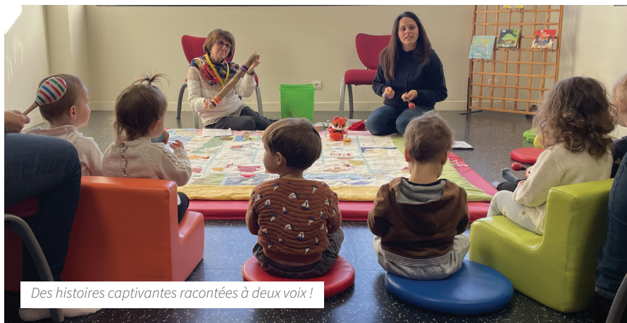
Des histoires captivantes racontées à deux voix !

Accueillir les tout-petits et accompagner les familles fait partie des engagements forts de la Communauté de communes du Val de Sarthe, qui a développé une offre de services adaptée à chaque situation. Tour d'horizon.